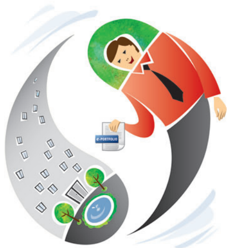
Illustratie Irina Grabarnik