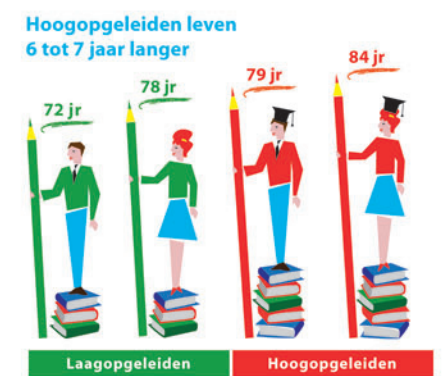
ILLUSTRATION Irina Grabarnik

illustration@irinagrabarnik.com www.irinagrabarnik.com Illustration Newsletter - Sign up here